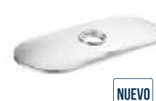
Fig. CF01 Cubierta para fregadero