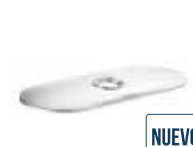
Fig. CF02 Cubierta para lavabo